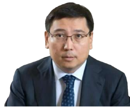
Ерболат ДОСАЕВ, аким города Алматы

Я ПРИНЯЛ РЕШЕНИЕ, ЧТОБЫ ЖЕЛЕЗНОДОРОЖНЫЕ ВОКЗАЛЫ «АЛМАТЫ-1» И «АЛМАТЫ-2» ВЕРНУЛИ АО «НК «ҚТЖ». У КОМПАНИИ В ПЛАНАХ ПРОВЕСТИ РЕМОНТ, ВЛОЖИТЬ СРЕДСТВА НА ИХ РАЗВИТИЕ. ВЕДЬ ОБА ВОКЗАЛА – ЭТО ОЧЕНЬ ВАЖНЫЕ ОБЪЕКТЫ ТРАНСПОРТНОЙ ИНФРАСТРУКТУРЫ.