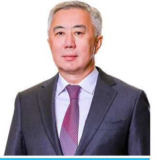
Серик ЖУМАНГАРИН, заместитель Премьер-министра РК

ПЕРЕД НАМИ СТОИТ ЗАДАЧА – ПОСТАВИТЬ ДВА МИЛЛИОНА ТОНН ЗЕРНОВЫХ В КИТАЙ В ЭТОМ ГОДУ, НО МЫ МОЖЕМ УВЕЛИЧИТЬ ОБЪЕМЫ ДО ТРЕХ МИЛЛИОНОВ ТОНН. ТАКЖЕ НАДО НАРАЩИВАТЬ ПОСТАВКИ МУКИ В АФГАНИСТАН. НОВЫЕ КОНТРАКТЫ И ЛОГИСТИКА ДОЛЖНЫ СТАТЬ ОДНИМ ИЗ ГЛАВНЫХ ВОПРОСОВ НА ПРЕДСТОЯЩЕМ КАЗАХСТАНСКО-АФГАНСКОМ БИЗНЕС-ФОРУМЕ В АЛМАТЫ.