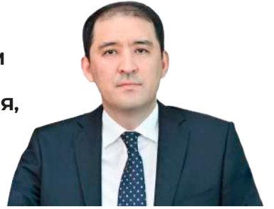
Жанибек ТАЙЖАНОВ, вице-министр транспорта РК

СЕГОДНЯ ТРАНСПОРТНАЯ ОТРАСЛЬ КАЗАХСТАНА – ОДИН ИЗ ДРАЙВЕРОВ ЭКОНОМИЧЕСКОГО РОСТА. ПО ИТОГАМ ПРОШЛОГО ГОДА ОБЪЕМ ТРАНСПОРТНЫХ УСЛУГ СОСТАВИЛ 12,2 ТРИЛЛИОНА ТЕНГЕ, ИНВЕСТИЦИИ ПРЕВЫСИЛИ 4 ТРИЛЛИОНА ТЕНГЕ, А ОБЪЕМ ТРАНЗИТА ДОСТИГ 39 МИЛЛИОНОВ ТОНН С РОСТОМ НА 18%. КАЗАХСТАН ПОСЛЕДОВАТЕЛЬНО РАСШИРЯЕТ ПРОПУСКНУЮ СПОСОБНОСТЬ ЖЕЛЕЗНОДОРОЖНОЙ СЕТИ, РЕАЛИЗУЕТ КРУПНЫЕ ИНФРАСТРУКТУРНЫЕ ПРОЕКТЫ И ВНЕДРЯЕТ ЦИФРОВЫЕ РЕШЕНИЯ, ВКЛЮЧАЯ IT-ПЛАТФОРМУ СРЕДНЕГО КОРИДОРА ДЛЯ ОТСЛЕЖИВАНИЯ КОНТЕЙНЕРОВ И УСКОРЕНИЯ ТАМОЖЕННЫХ ПРОЦЕДУР.