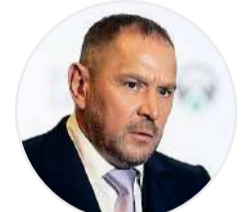
Сергей ПАВЛИНГЕР, Railways Systems KZ холдингінің басқарма төрағасы: