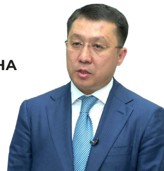
Марат КАРАБАЕВ, министр индустрии и инфраструктурного развития РК

СТРОИТЕЛЬСТВО КОНТЕЙНЕРНОГО ТЕРМИНАЛА В ПОРТУ ПОТИ ПОЗВОЛИТ КАЗАХСТАНСКОМУ И ГРУЗИНСКОМУ БИЗНЕСУ НЕ ТОЛЬКО УЧАСТВОВАТЬ В ФОРМИРОВАНИИ ГРУЗОВЫХ ПОТОКОВ, А ТАКЖЕ СОЗДАСТ ВЫГОДНЫЕ ТАРИФНЫЕ УСЛОВИЯ НА МАРШРУТЕ ТМТМ. КРОМЕ ТОГО, ЭТО ДОЛЖНО ПРИВЛЕЧЬ ДОПОЛНИТЕЛЬНЫЕ ОБЪЕМЫ ТРАНЗИТНЫХ ГРУЗОВ ЧЕРЕЗ КАЗАХСТАН И ГРУЗИЮ.