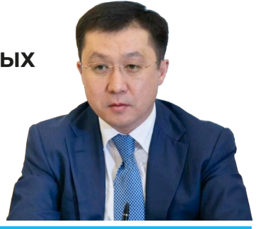
Марат КАРАБАЕВ, министр транспорта РК

КАЗАХСТАН ГОТОВ УЧАСТВОВАТЬ В РЕАЛИЗАЦИИ СТРОИТЕЛЬСТВА ЖЕЛЕЗНОЙ ДОРОГИ ТЕРМЕЗ – МАЗАРИ – ШАРИФ – КАБУЛ – ПЕШАВАР ПОСРЕДСТВОМ ПРЕДОСТАВЛЕНИЯ МАТЕРИАЛОВ ВЕРХНЕГО СТРОЕНИЯ ЖЕЛЕЗНОДОРОЖНЫХ ПУТЕЙ. УБЕЖДЕН, ЧТО РЕАЛИЗАЦИЯ ПРОЕКТА БУДЕТ СПОСОБСТВОВАТЬ РАЗВИТИЮ РЕГИОНАЛЬНОГО СООБЩЕНИЯ И ТОРГОВЛИ ДЛЯ СТРАН ЦЕНТРАЛЬНОЙ АЗИИ, ТАК КАК ОТКРОЕТСЯ ДОСТУП К КРУПНЫМ МОРСКИМ ПОРТАМ ЮЖНО-АЗИАТСКОГО РЕГИОНА.