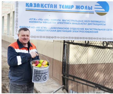
Организаторами проведения Дня здоровья выступили Акмолинский филиал ОО «Казахстанский отраслевой профсоюз работников железнодорож-

В рамках акции «Никотин на витамин» работникам предлагалось сигареты поменять на яблоки. А тем работникам, кто не курит, предлагалось выполнить одно из упражнений – отжимание либо приседание. Затем возле здания Акмолинского отделения ГП прошла утренняя зарядка, в которой приняли участие более 40 работников всех предприятий Кокшетауского узла.