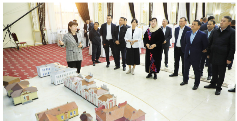
«Қазкөліккәсіп» ұйымының Шымкент филиалы ұйымдастырған жиынға «Жүк тасымалы»

Рамазан айының 25-ші күнінде түркістандық теміржолшылар Арыс қаласында бас қосып, Наурыз мерекесін атап өтіп, қасиетті айда қатар келген оразаға орай ауызашар өткізді.