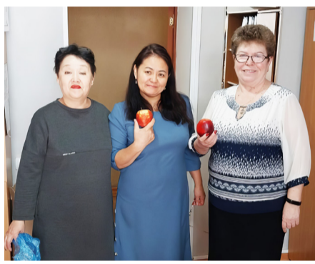
к здоровому образу жизни. – Сотрудники ВЧД-13 активно участвуют во всех городских, областных

В Карагандинском вагонном депо (ВЧД-13) прошла акция «Никотин на витамин», приуроченная ко Дню здоровья.