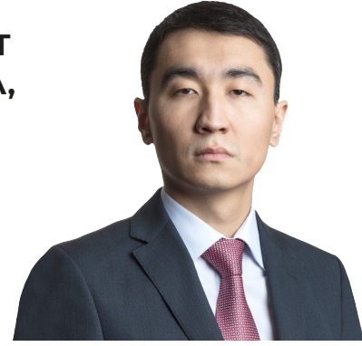
Алмаз ИДЫРЫСОВ, вице-министр индустрии и инфраструктурного развития РК

НА СЕГОДНЯШНИЙ ДЕНЬ ТРАНСКАСПИЙСКИЙ МЕЖДУНАРОДНЫЙ ТРАНСПОРТНЫЙ МАРШРУТ ОБРЕТАЕТ БОЛЬШУЮ ПОПУЛЯРНСТЬ, ТАК КАК ОН ПРОХОДИТ ЧЕРЕЗ ТЕРРИТОРИИ КАЗАХСТАНА, АЗЕРБАЙДЖАНА, ГРУЗИИ, ТУРЦИИ И В ЕВРОПУ. ПОЭТОМУ РАЗВИТИЕ ТРАНСПОРТНО-ЛОГИСТИЧЕСКОГО КОМПЛЕКСА ЯВЛЯЕТСЯ ВАЖНЫМ КОМПОНЕНТОМ ВНЕШНЕЭКОНОМИЧЕСКИХ И ВНЕШНЕТОРГОВЫХ СВЯЗЕЙ С ГОСУДАРСТВАМИ – ЧЛЕНАМИ ОРГАНИЗАЦИИ ТЮРКСКИХ ГОСУДАРСТВ.