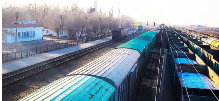
АТЫРАУ ТЕМІРЖОЛ ТОРАБЫ БОЙЫНША СУ ШАЙЫП КЕТУГЕ ҚАРСЫ 2 ПОЙЫЗ, 15 ВАГОН ЖАСАҚТАЛҒАН. ОНЫҢ ІШІНДЕ АТЫРАУ ЖОЛ ДИСТАНЦИЯСЫ БОЙЫНША 9 ВАГОН, ҚҰЛСАРЫ ДИСТАНЦИЯСЫ БОЙЫНША 6 ВАГОН ДАЙЫНДАЛҒАН.

Атырау магистральдық желі бөлімшесі бастығының міндетін атқарушы Амангелді Рахмеденов – тің мәліметінше, 2023 жылғы көктемгі су тасқыны, сең, өр, қар мен жаңбыр суы