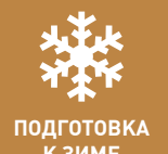
ПОДГОТОВКА К ЗИМЕ

Костанайское эксплуатационное отделение грузоперевозок на все 100% завершило подготовку к зиме.