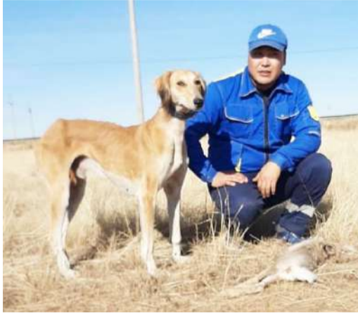
серуен», – дейді ол. Еркіннің айтуынша, тазы – тек аң аулайтын ит емес, адамның сенімді серігі. Қазір оның

«2010 жылдан бері тазы ұстаймын. Тазының өз бабы бар, уақытында тамағын беріп, күтімін жасап, спортшы сияқты бабында ұстау керек. Мен жұмысыма байланысты үнемі далада, жол аралығында, көбіне жаяу жүремін. Сондайда қасыма ертіп аламын, маған кәдімгідей серік, оған бой жазатын