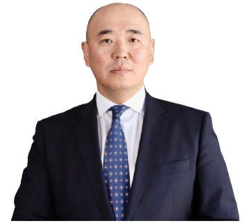
Канат ШАРЛАПАЕВ, министр промышленности и строительства РК

В 2024 ГОДУ ОТЕЧЕСТВЕННЫМИ ЗАВОДАМИ ПРОИЗВЕДЕНО 124 ЛОКОМОТИВА, ЧТО ЯВЛЯЕТСЯ РЕКОРДНЫМ ПОКАЗАТЕЛЕМ ДЛЯ КАЗАХСТАНА, И ПОРЯДКА 2 155 РАЗЛИЧНЫХ ВАГОНОВ. В ПОСЛЕДНИЕ ГОДЫ БИЗНЕС АКТИВНО ИНВЕСТИРУЕТ В МОДЕРНИЗАЦИЮ И РАЗВИТИЕ ЖЕЛЕЗНОДОРОЖНОГО МАШИНОСТРОЕНИЯ. ОДНИМ ИЗ КРУПНЕЙШИХ ШАГОВ СТАЛО СОЗДАНИЕ НОВЫХ И МОДЕРНИЗАЦИЯ СУЩЕСТВУЮЩИХ ЗАВОДОВ ПО ПРОИЗВОДСТВУ ВАГОНОВ И КОМПЛЕКТУЮЩИХ.