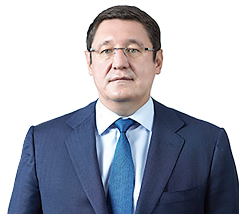
Алмасадам САТКАЛИЕВ, председатель правления АО «Самрук-Қазына»

В АО «САМУРК-ҚАЗЫНА» ТЕКУЩИЙ ГОД ОБЪЯВЛЕН ГОДОМ БЕЗОПАСНОСТИ И ОХРАНЫ ТРУДА. КАЖДОМУ ИЗ НАС НЕОБХОДИМО ЗАДУМАТЬСЯ О ЛИЧНОМ ВКЛАДЕ В УЛУЧШЕНИЕ СИСТЕМЫ ПРОИЗВОДСТВЕННОЙ БЕЗОПАСНОСТИ, СТАВИТЬ КОНКРЕТНЫЕ ЦЕЛИ, СПОСОБСТВУЮЩИЕ ДОСТИЖЕНИЮ ВЫСОКОГО УРОВНЯ ПРОФИЛАКТИКИ ПРОИСШЕСТВИЙ, НЕСЧАСТНЫХ СЛУЧАЕВ И ТРАВМАТИЗМА НА РАБОЧИХ МЕСТАХ.