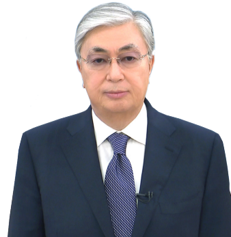
Касым-Жомарт ТОКАЕВ, Президент Республики Казахстан

ВМЕСТЕ С КИТАЙСКИМИ КОЛЛЕГАМИ МЫ РЕШИЛИ ПОСТРОИТЬ ЛОГИСТИЧЕСКИЙ ЦЕНТР В СУХОМ ПОРТУ СИАНЬ. ЭТОТ ХАБ СОЕДИНЯЕТ РЕГИОН ШЭНЬСИ С КАЗАХСТАНОМ, ЦЕНТРАЛЬНОЙ АЗИЕЙ. ДАЛЕЕ ОН ОТКРОЕТ ДОРОГУ В ЕВРОПУ, ТУРЦИЮ И ИРАН. УВЕРЕН, ЧТО ПОЛНЫЙ ЗАПУСК ПРОЕКТА ПРИДАСТ НОВЫЙ ИМПУЛЬС СОТРУДНИЧЕСТВУ ДВУХ СТРАН.