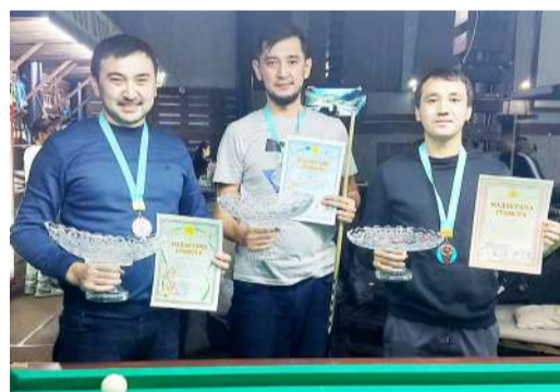
Благодаря профессионально выстраиваемым геометрическим линиям на столе ему удалось расположиться на второй позиции. Третье место досталось специалисту службы производствен-

В Алматы прошли соревнования по бильярду. Для участия в турнире железнодорожники собрались в клубе Green Wood.