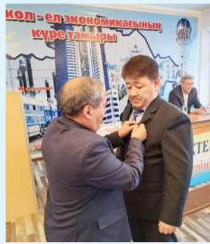
Қол – ел қолымен қызылордалық электрмен жабдықтау дистанциясында энергетиктер күніне орай салтанатты жиын өтіп, үздіктер марапатталды.