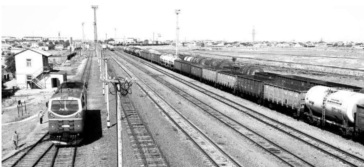
Қосұйым МҰҚАШЕВ, Атырау

Атырау жүк тасымалы бөлімшесі үшінші тоқсанды да табысты қорытындыланып, жоспарды орындап отыр. Өткен тоғыз айда техникалық жоспарға сай негізгі 12 көрсеткіш 100 пайыздан асты.