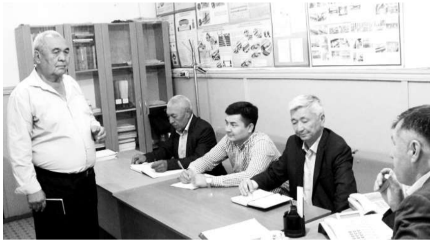
Бұл тексеру Ұлттық компаниядан жеткен телеграфтық пәрменге орай бөлімше басшылығы тарапынан жасақталған комиссиялық құраммен өткізілуде. – «ҚТЖ-ЖТ» АҚ өндірістік қауіпсіздік

Жалағаш станциясына маңайдағы Қараөзек пен Қызылтам станциялары арасындағы шағын бекеттерден станция кезекшілері, белгі берушілер, пойыз құрастырушылар, парк кезекшілері, жалпы алғанда әр бекеттің жұмысына жауапты 20 шақты теміржолшы жиналған