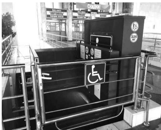
Айдана ЕРТАЙ, Павлодар

На павлодарском железнодорожном вокзале созданы благоприятные условия для людей с ограниченными возможностями. Сегодня здесь имеется лифт, с помощью которого можно подняться на второй этаж, и отдельный подъемник в подземном переходе. Такое специальное оборудование кроме Павлодара есть только в столице.