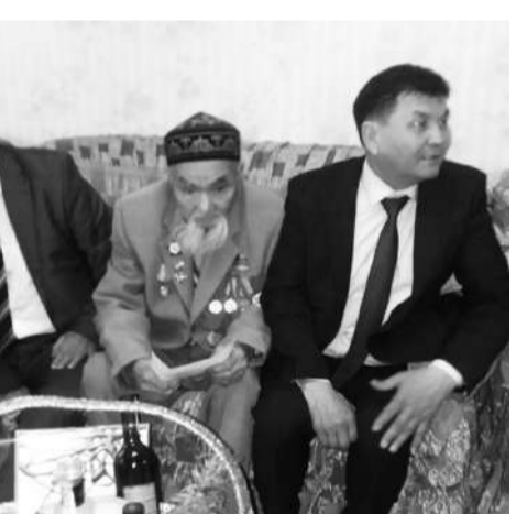
қарсаңында өздерін құттықтай келгендерді қуана қарсы алған майдангерлер оларға батасын беріп, бейбіт күннің алаңсыз еңбегін тіледі.

Майдангерлерге бөлімше теміржолшылары тарапынан өзге де көмектер ұдайы беріліп отырады. Сураныс тілектерін екі еткен жері жоқ. Мереке