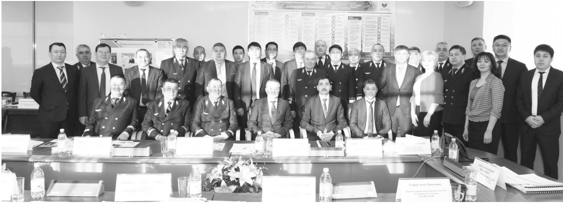
(Соңы. Басы 1 бетте)

«Барлық қауіпсіздік шараларын сақтай отырып, қызметкерлердің мінез-құлқы мен санасын өзгерту үшін бөлімшенің әрбір басшысы еңбек ұжымдарында қарапайым түсіндіру жұмыстарын жүргізіп, өз жұмысын қайта құруы тиіс. Ол үшін барлық басқару деңгейіндегі басшыларда өндірістік қауіпсіздік саласындағы негізгі көрсеткіштер болуы қажет. Бірінші – ашықтыққа қол жеткізу, яғни барлық микротраммаларды көрсету, өндірістігі жасырын жазатайым оқиғаларды жою; екінші – қауіпсіз еңбек үшін қызметкерлерді ынталандыруды қайта қарау; үшінші – басқарудың барлық деңгейлерінде қауіпсіздіктің мінез-құлықтық диалогын өткізу және олардың сапасын арттыру; сонымен қатар форумдар, олимпиадалар, семинарлар және бұқаралық ақпарат құралдарында жарияланымдар ұйымдастыру; қызметкерлерді міндетті медициналық тексерумен уақытылы және толық қамту, медициналық қызметтерді орындау талаптарын нақтылау және қатаңдату; сондай-ақ, санитарлық-гигиеналық нормалар мен корпоративтік талаптарға сәйкес санитарлық-тұрмыстық нысандарды толық жабдықтау және күтіп ұстау; ең бастысы Жұмысты ТОҚАТ және Near-miss