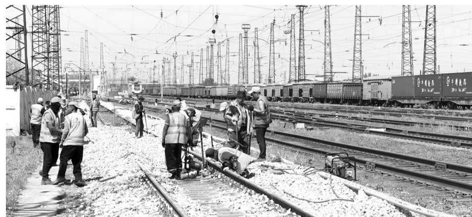
деревянных шпал, переводных брусьев на стрелочных переводах.

По его словам, эти работы позволят обеспечить плавность хода движения поездов. Создаются условия для наилучшего взаимодействия пути и подвижного состава, что продлевает сроки их службы, уменьшает расходы на ремонт и содержание. В этой связи ремонт делали планомерно, пошагово. Сначала монтеры пути провели подготовительные работы, затем приступили к замене