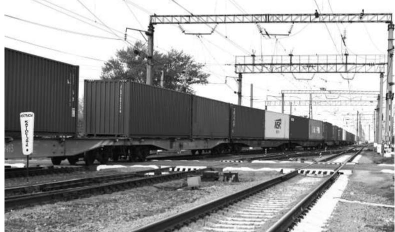
плану. Всего за первое полугодие текущего года по Акмолинскому отделению ГП проследовало 1184 контейнерных поездов.