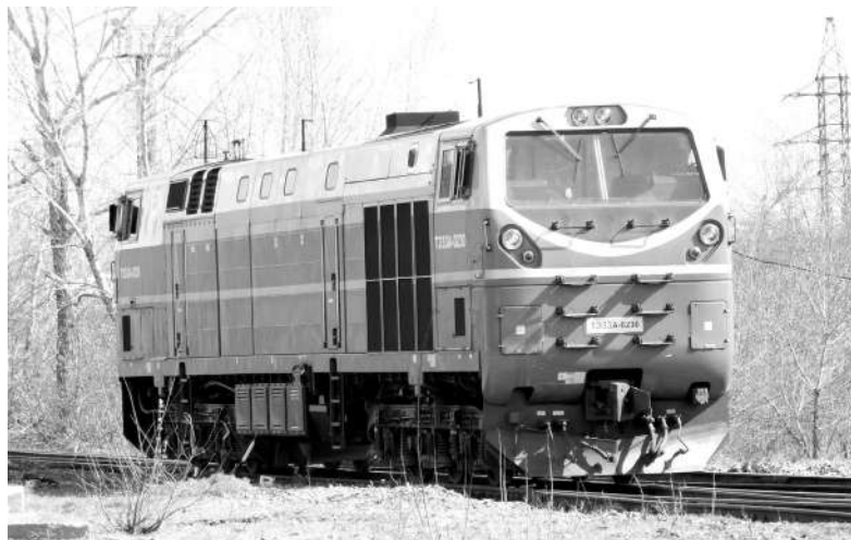
плановый ремонт не допущено.

За пока еще короткий отрезок времени при проведении ОКО случаев заходов локомотивов на вне-