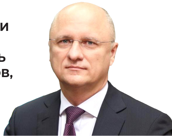
Роман СКЛЯР, заместитель Премьер-министра Республики Казахстан

РАЗВИТИЕ ВЗАИМОВЫГОДНОГО ПАРТНЕРСТВА С ИНВЕТОРАМИ ИЗ ГЕРМАНИИ ПО ШИРОКОМУ СПЕКТРУ НАПРАВЛЕНИЙ НОСИТ СТРАТЕГИЧЕСКИЙ ХАРАКТЕР ДЛЯ КАЗАХСТАНА. В ЭТОЙ СВЯЗИ КАЗАХСТАНСКАЯ СТОРОНА ГОТОВА ОКАЗАТЬ ПОЛНОЕ СОДЕЙСТВИЕ ДЛЯ УСПЕШНОЙ РЕАЛИЗАЦИИ СОВМЕСТНЫХ ПРОЕКТОВ, В ТОМ ЧИСЛЕ В ОБЛАСТИ ТРАНСПОРТА И ЛОГИСТИКИ.