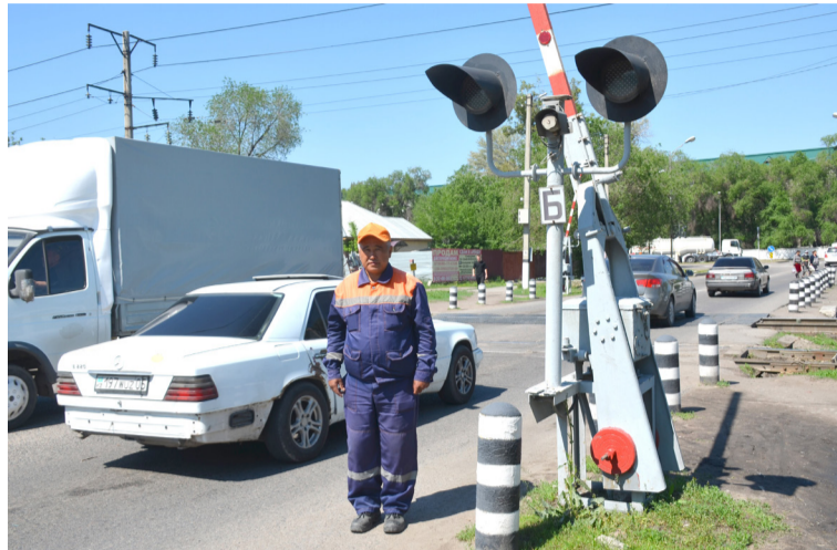
и местных жителей происходит на переезде 1664-й километр станции Байсерке, на переезде

Несмотря на то, что недавно здесь установлено видеонаблюдение, автолюбителей это не останавливает. Они забывают, что несоблюдение установленных норм может стоить человеку