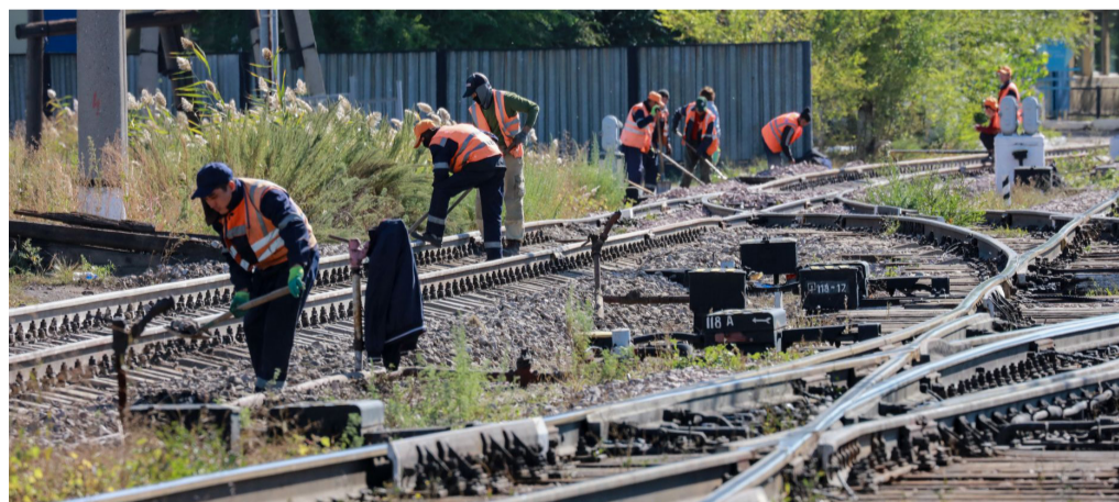
(Соңы. Басы 1 бетте)

Ішкі жаттықтырушының айтуынша, корпоративтегі қауіпсіздік мәдениеті жұмысшылардың санасында болуы керек, ал жұмыскердің санасына жеткізу үшін, басшылар біріншіден өздерінің көзқарастарын түбегейлі өзгертуі қажет. Мәселен, Орталық аппараттан өндіріс жұмыстарын тексеруге комиссия келді делік. Бұл жағдайда, жергілікті басшылық не істеу керек? Ең алдымен келген тексеруші меймандарға қауіпсіздік ережелерінің талаптарына сай нұсқаулық өткізіп, қасқа беріп, яғни жалпыға бірдей ереже талабын сақтау керек.