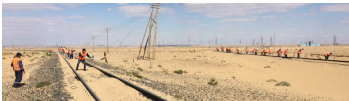
(Соңы. Басы 1 бетте)

Штабқа жұмысшы қабылдауға мораторий бар. Сондықтан уақытша жіберілген адамдардың мерзімін тағы да ұзартуды сұраймыз. Бейнеуде қыста қар көп болмаса да, жел жиі соғады. Табиғаты қатал. Бұрындары да құм басып тұратын, бірақ дәл биылғы жағдай ерек. Құмды тоқтатуға қойған кедергілерден қатты жел-боранда қайыр жоқ. Техниканың көмегіне жүгінейік десек, әзірге ондай машина шығарылмаған. Бастақы кездері қар тазалайтын техниканы құмға қолданып көрдік. Пайдасынан зияны көп болды. Мойынтректер ішіне құм кіріп, бұзыла берді. Қолмен тазалаудан басқа амал қалмады. Қазір күшіміз топырақты тек жолдың шетіне тастауға